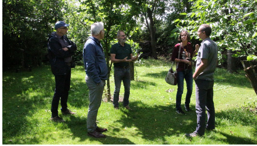
De Zandse Notenggaard - Ervaar de complete belevenis van de not -

< een indruk van het bezoek van hogeschool VHL aan De Zandse Notenggaard